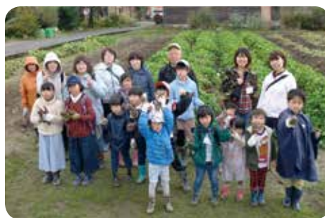
親子わくわく農業体験 〜ブロッコリー&さつまいも収穫〜

かなり力が足りませんが、立派なさつまいもがたくさん掘れました。調理し湯気があがった採れたての野菜からは、とてもいい匂いがして、□いっぱいに頬張った参加者からは「甘い！おいしい〜」との声が聞かれました。JAのおじちゃんたちは、みなさんに炭火の香りの焼き芋を食べてもらいたい。との強い思いから必死でうちわをあおぎました(笑)