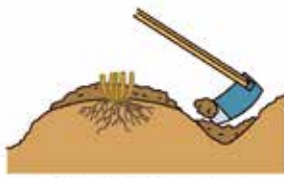
畝上に土を大きく盛り上げ防寒する

却または廃棄します。この処置が不十分だと、病原菌が茎葉の中で越冬し、翌年の発生源になるからです。できるだけ丁寧にかき集めて処分することが肝心です。