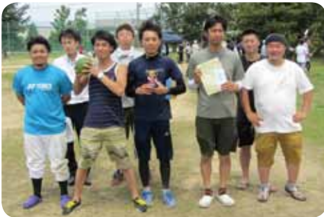
第三位中央支部のみなさん

金沢市の県営湊グラウンドにて開催され、全11チームが夏空のもと白熱した試合を繰り広げました。今年も中央支部は熱い試合を展開しましたが、準決勝で敗れ第3位となりました。一方、