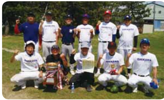
優勝した石川地区のみなさん

〔中央支部青年部・石川地区青年部〕 J A 松任青年部石川地区と J A 松任青年部中央支部は、7月15日（土）に、J A 石川県青壮年部による「第40回 J A 石川県青壮年部ソフトボール大会」に参加しました。