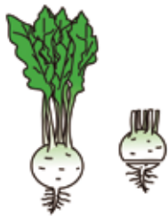
球の下部1〜1.5cmは堅いので切り落とす