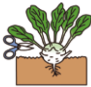
球の下部の葉は、葉柄を2〜3cm残して切り取る

種まきの適期は6月中旬から8月初旬ぐらいまでの夏まきと、9月上旬から10月上旬の秋まきです。