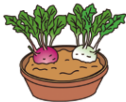
緑色と紅色の品種を対にして鉢植えで楽しむのも良い

畑は前もって石灰と堆肥を全面にまき、15〜20cmの深さによく耕しておき、種まきの前に、条間50cm、くわ幅の溝に、元肥として油かす、化成肥料を1平方m当たり、それぞれ大さじ3杯を施し、軽く覆土して、種子を2〜3cm間隔にまき付けます。