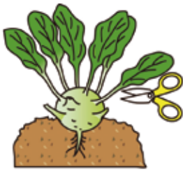
球の下部の葉は、葉柄を2〜3cm残して切り取る

ブロッコリーの茎に似た癖のないこくのある味で、歯応えが良く、甘味もあります。皮をむいて薄切りにし、サラダやあえ物、ぬか、塩漬けに。また炒め物やクリーム煮にしたり、油揚げなどと合わせて煮物にしたりと、今風にいろいろアレンジしてみてくださいでしょう。ビタミンCはカブの3〜4倍、カリウムも豊富