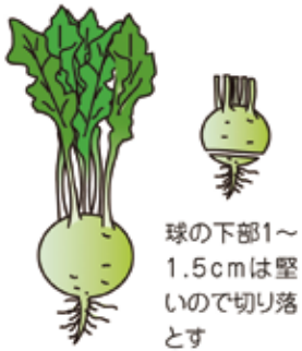
球の下部1〜1.5cmは堅いので切り落とす