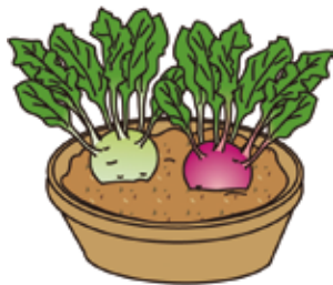
緑色と紅色の品種を対にして鉢植えで楽しむのもよい