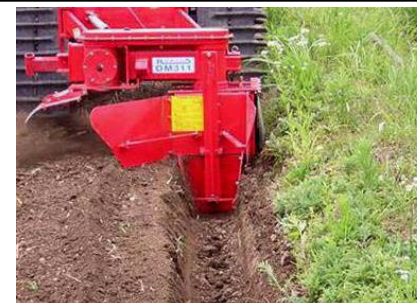
トレンチャーによる額縁排水溝の設置