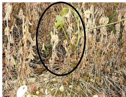
葉が残る緑株・茎が緑色は抜く