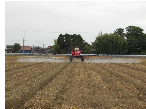
乗用管理機による除草剤散布