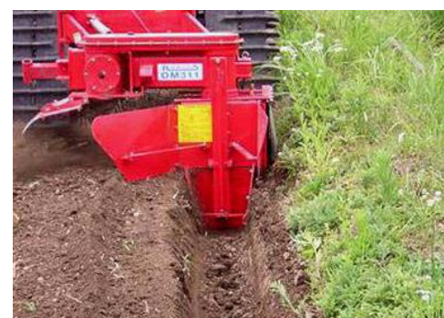
トレンチャーによる額縁排水溝の設置