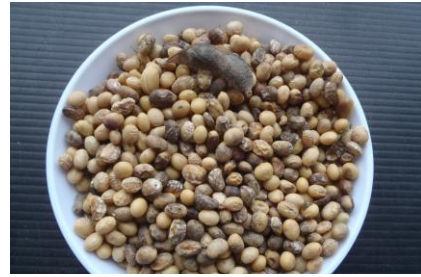
刈り取ったエンレイ（腐敗粒が多発）