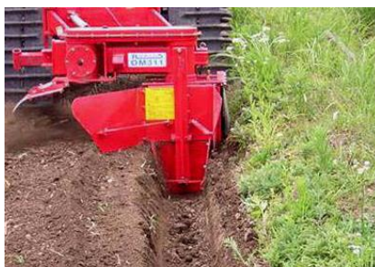
トレンチャーによる額縁排水溝の設置