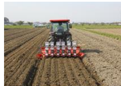
幅3m以内の排水溝の設置（は種時）