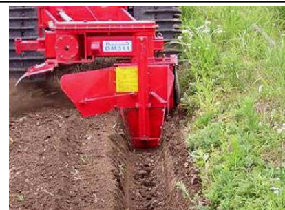
トレンチャーによる額縁排水溝の設置