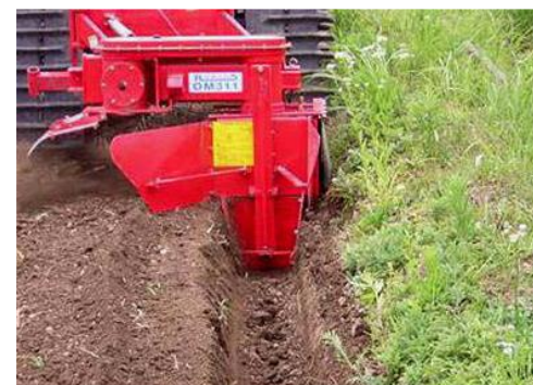
トレンチャーによる額縁排水溝の設置

排水性の向上は出芽・苗立ちの安定だけでなく、降雨が続いても水の引きが早いいため培土や除草剤散布などの作業タイミングを逸することが少なくなり効果も高まります。