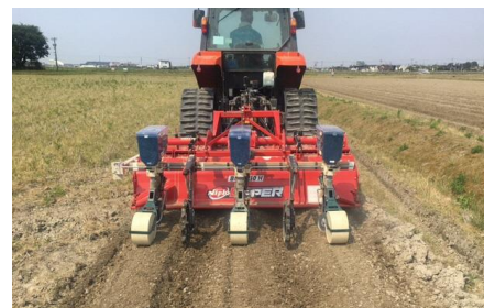
アップカットロータリーによる 耕うん同時うね立て播種