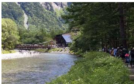
「健康ウォーキング上高地」