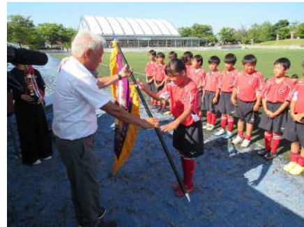
「少年サッカー大会」