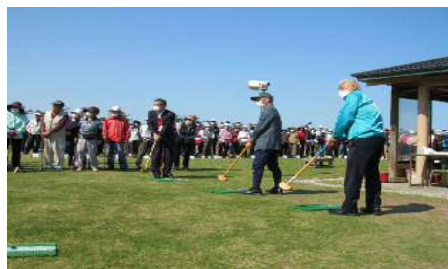
「グラウンドゴルフ大会」