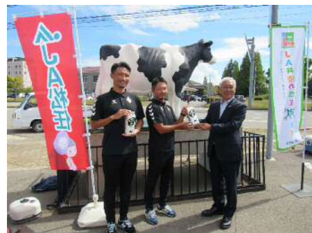
「おまっと牛乳贈呈式」