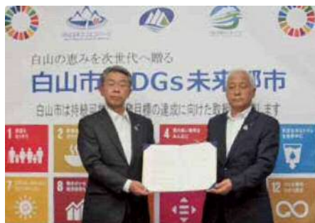
「まちづくり開発協定調印式」