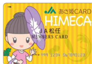
「総合ポイント あさ姫カード」