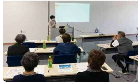
「女性目線で考える円満相続セミナー」