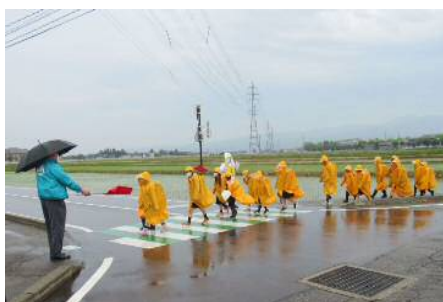
「交通安全運動への参加」