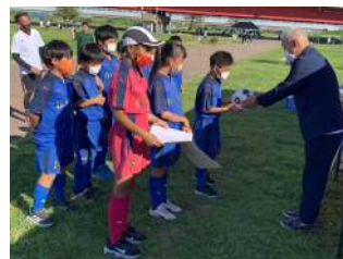
「少年サッカー大会」