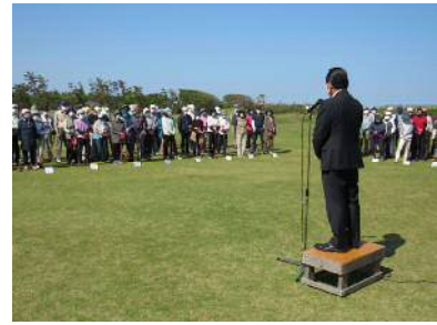
「グラウンドゴルフ大会」