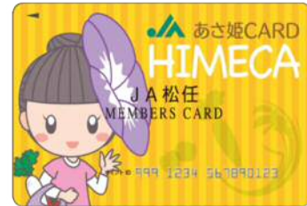
「総合ポイント あさ姫カード」