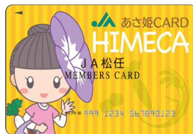
「総合ポイント あさ姫カード」