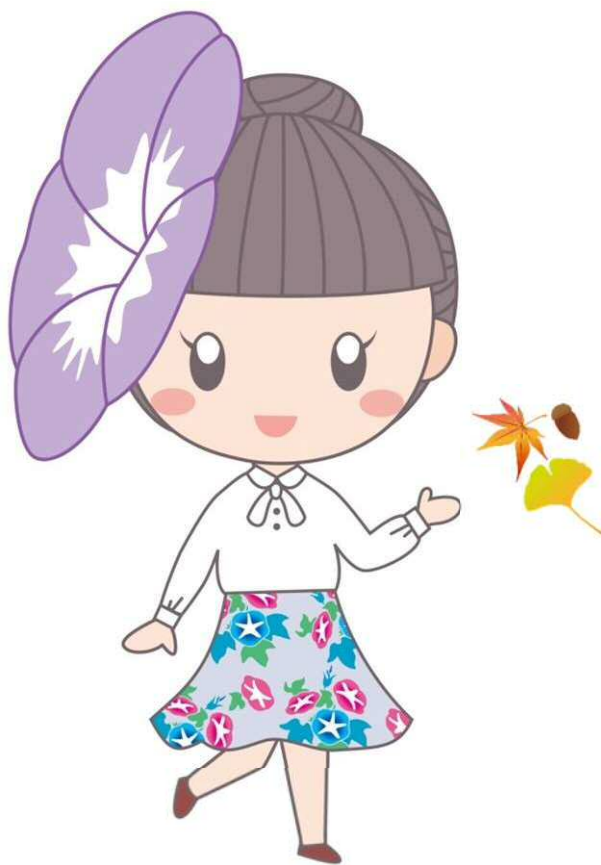
あさがお娘イメージキャラクター あさ姫ちゃん