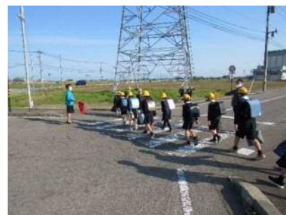
「交通安全運動への参加」