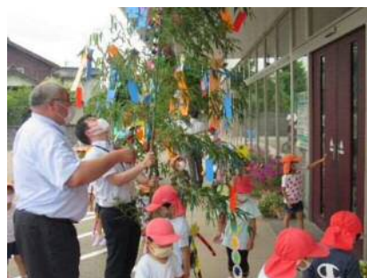
「地元園児と七夕飾り付け」