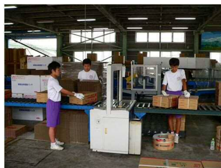
「中学生の体験学習」