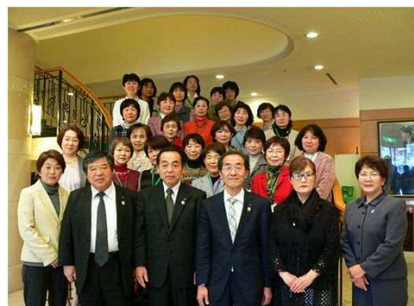
「女性大学『あさ姫スクール』」