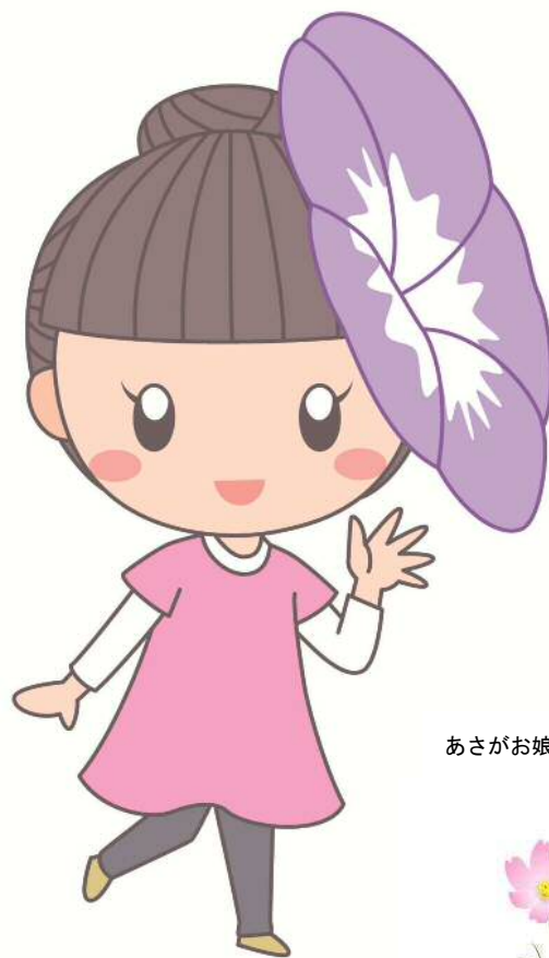
あさがお娘 あさ姫ちゃん