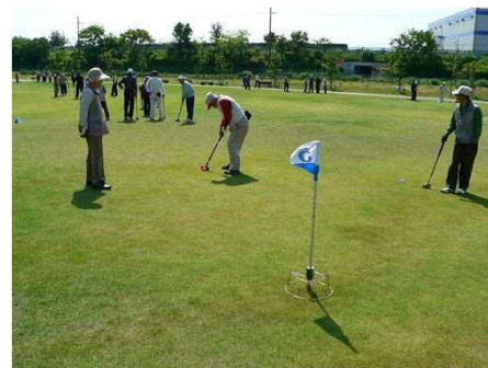
「グラウンドゴルフ大会」