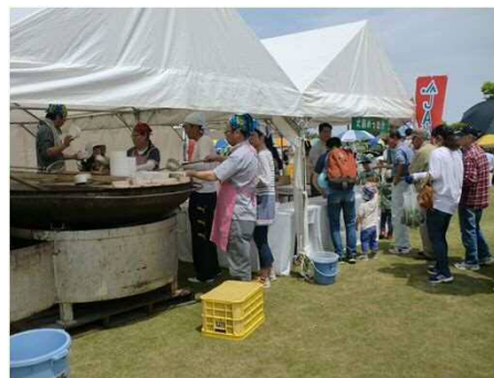
「緑と花のフェスティバル」