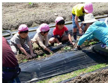
「保育園児とさつまいも定植」