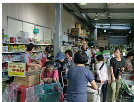
「新米コシヒカリおにぎり無料配布」