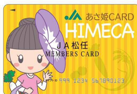
「総合ポイントあさ姫カードHIMECA」