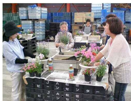
「女性の会（ガーデニングクラブ）」