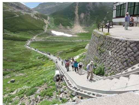
「健康ウォーキング」